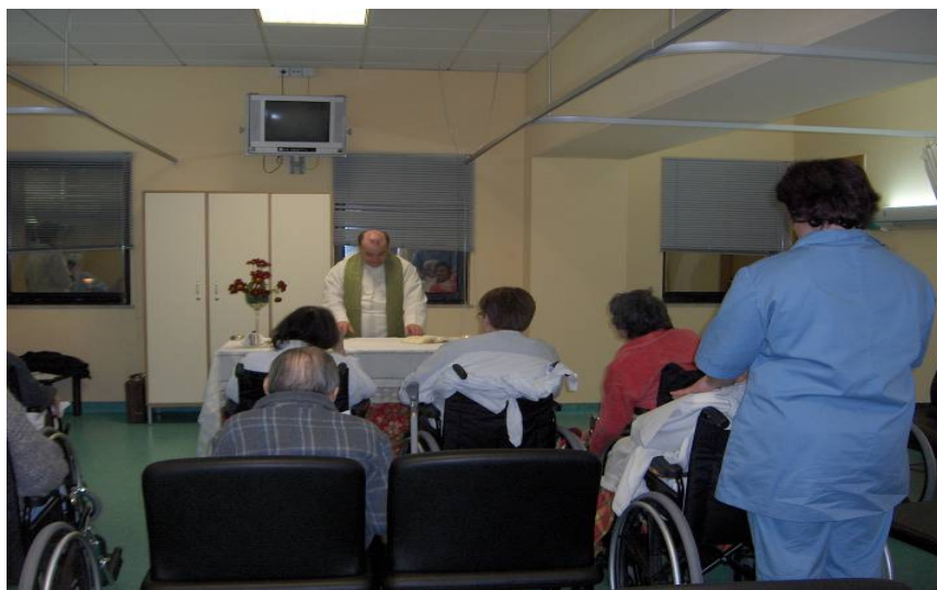
Áreas Comuns e Multiusos e de humanização