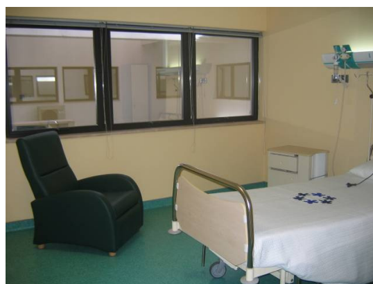
Unidade Funcional de Internamento