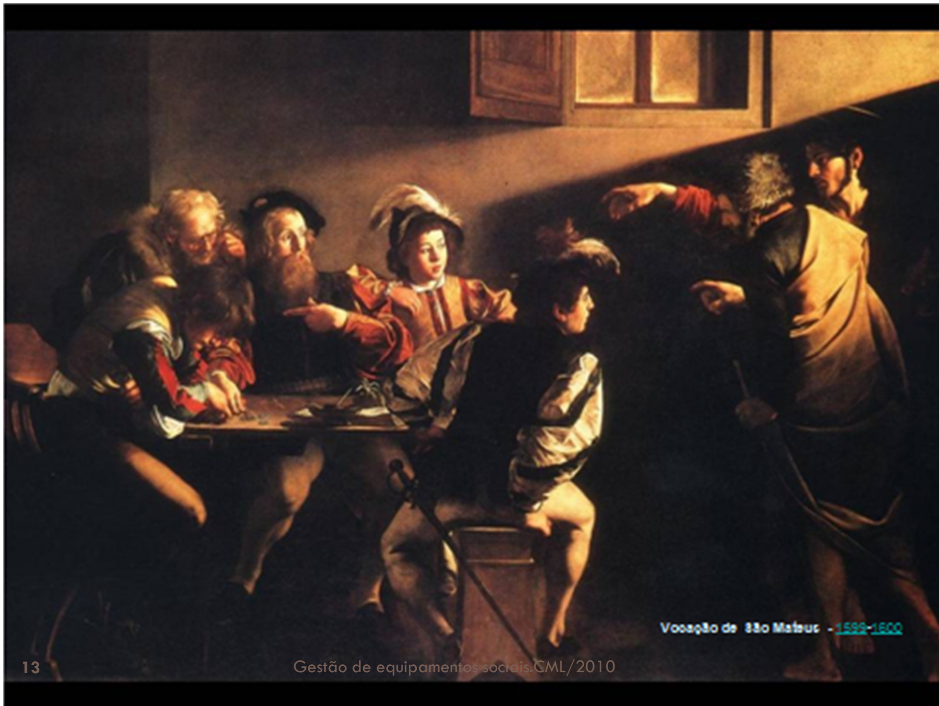
Vocação de São Mateus - 1599-1600